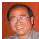
梅峰健保免費公 投